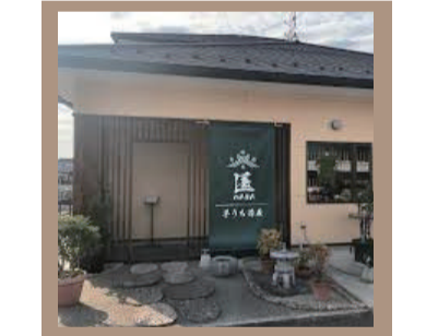
【手打ちそば 匡 中津川市新町】