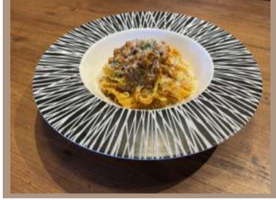
【恵那鶏のポロネーゼ】

お店のテーマは、「イタリアン&和食のカフェバル」。ランチタイムには、気軽に楽しめるパスタやピザが人気。一番よく出るのは「恵那鶏のポロネーゼ」。地元の恵那鶏をローストし、その旨味をたっぷり含んだソースをフィットチーネに絡めた一品は、イタリアの食材を代表するパスタと地元食材の融合からなる、この店の名物。