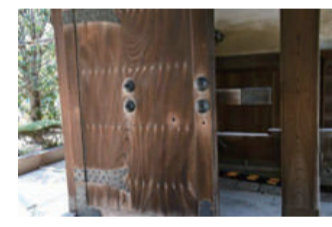
〔銃弾痕が残る経王寺の山門〕