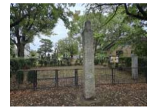
〔天王寺五重塔跡地〕