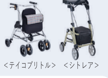
<テイコブリトル> <シトレア>

今回は歩行器の紹介をさせていただきます。駐車ブレーキ操作が必要な歩行器をご利用頂く中で、一番多いヒヤリハットである駐車ブレーキのかけ忘れ。そんなヒヤリハットに対応した歩行器の発売元は幸和製作所さんです。これまでに多く歩行器をこの世に生み出され、テイコブシリーズやシトレアシリーズなどの歩行器が代表的な商品です。