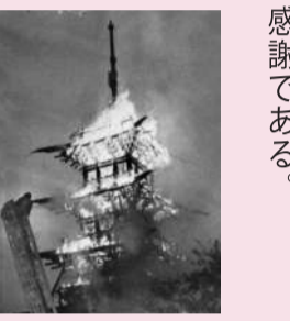
谷中天王寺五重塔 1957年放火により焼失